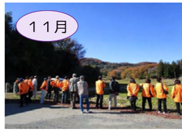
11月 群馬県邑楽郡板倉町 大曲作り推進協議会

小泉環境保全会と生田目環境保全会にご協力いただき、視察研修の受け入れをしました。どちらの組織も女性メンバーが多く活躍されており、幅広い年齢層で活動している様子でした。「益子町は地域の特色を生かした活動をしていますね。」との声をかけて頂きました。お互いに有意義な時間を過ごすことができました。ご協力ありがとうございました。