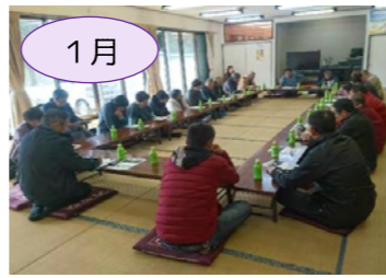
1月 那須塩原市 百村新田農地水安全管理会